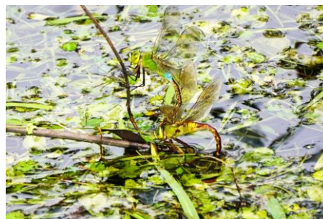
産卵中のギンヤンマ