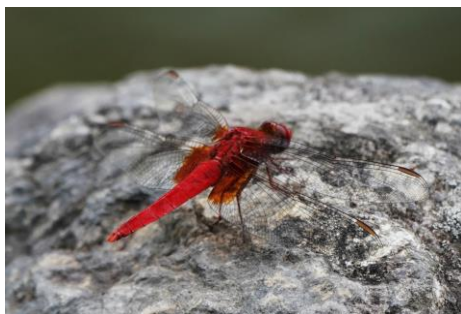
ショウジョウトンボ♂