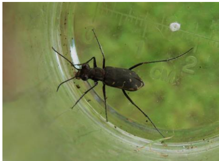
草地で見つけたニワハンミョウ