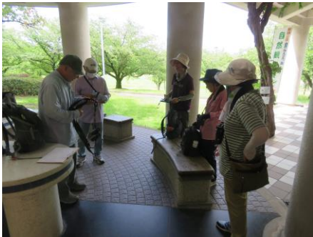
観察会開始の様子