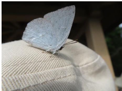
○帽子に止まるウラギンシジミ

市の広報誌に「市民の森自然観察会」の案内が掲載され、誰でも参加できると書いてあったから、リュックにオニギリと水筒とカメラを詰めて参加した。天気は穏やかな秋晴れで、参加者25名。主催者の大牟田生物愛好会には、植物、昆虫、野鳥など各部門の専門講師が数名おられ、詳しく説明されるので私も楽しいひと時を過ごした。