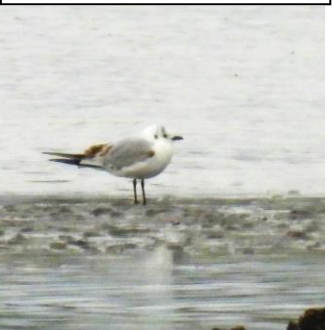
1/3(旧 11/22)福岡市西区今津 大濠公園等のユリカモメに似るが 嘴が黒いズグロカモメ。この種も 諫早干拓消滅の影響大。(VU)