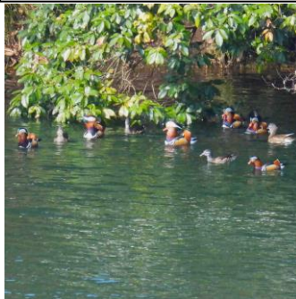
1/2(旧 11/21)筑紫野市山口 オシドリ夫婦というが、90%以上 の種で「つがい外子」が普通らし い。何はともあれ平和が何より・