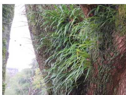
咲き始めたレンギョウの花