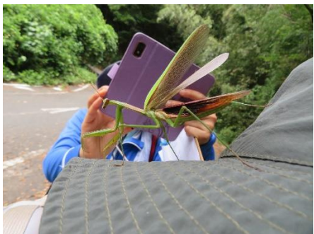
○帽子の上で威嚇するオオカマキリ