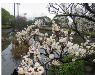
ボケの花、数輪の一つ