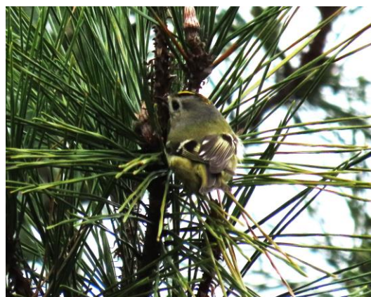
海の中道の松林で2024年1/19見かけたキクイタダキ