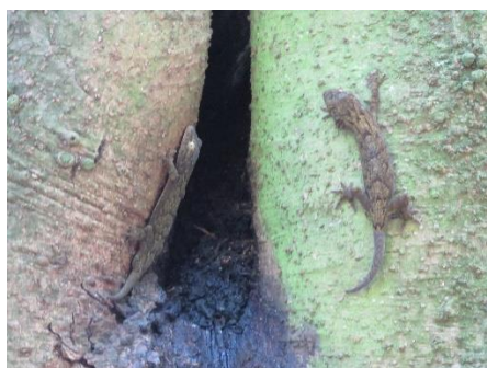
○樹の洞から出てきたヤモリ