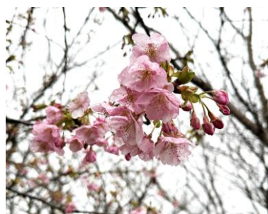
福岡市早良区室見川にて 撮影2024年2/7:宇都順吉

2/7の午前中、観察会の下見で仲間4人と、小雨の中、室見川を歩きました。もう河津桜が開花していました。雨の雫にいい色つやでした。春が来ましたか？と花に問いかけた寒さの中でした。すぐ上空をなぎながら飛ぶイワツバメの群れは、近くの橋の下で巣作り中です。生きもの散策の楽しさですね。