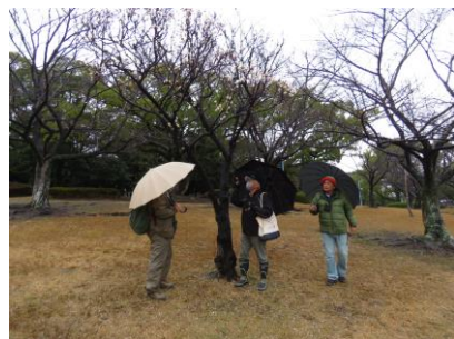
シバザクラ(桃色の花)