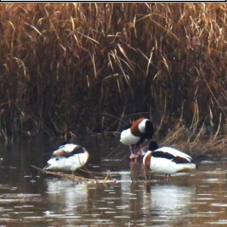
1/3(旧 11/22)福岡市西区今津 有明海を中心に北部九州の冬 鳥だったので筑紫鴨。だが諫早 干拓消滅で関西等各地に分散。