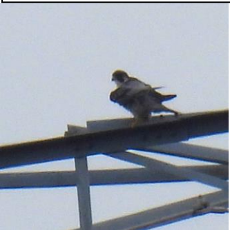
1/2(旧 11/21)筑紫野市山口 600m程先の高圧鉄塔の上に 止まったハヤブサ。最近あまり 見ない。孤高は憧れるが・(VU)