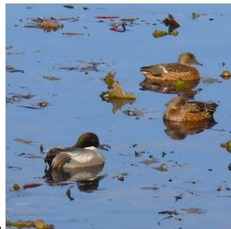
1/2(旧 11/21)筑紫野市搭原南 マガモの仲間のヨシガモ。この属 では珍しい一夫多妻らしい。オス の飾り羽の美しさはその為か。