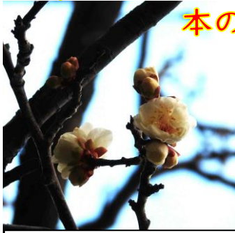
1/1(旧 11/20)春日公園 白梅が5輪ほど咲いていた。温か かったけんねえ。(今年の大宰府 飛梅は1月12日であった)

今回は、1月1日(旧暦 11月20日)~1月31日(旧暦 12月21日) までのデジカメ日誌です。(文・写真 本のむし)