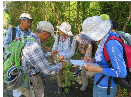
○みなさん研究熱心です