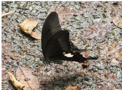
○吸水するモンキアゲハ