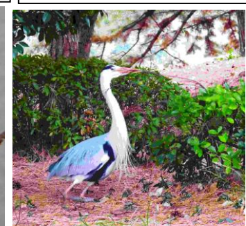
1/27(旧 12/17)中央区大濠公園 公園の中の島。通行人の多いす ぐ横の植込みで、アオサギが巢 材の小枝集めに夢中。