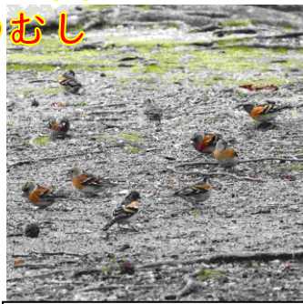
1/1(旧 11/20)春日公園 アトリの群れが地上で採餌してい る。アメリカフウの種か。「集まる 鳥」でアトリとなったそう。