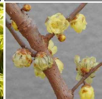
1/25(旧 11/15)筑紫野市天拝坂 隣家のロウバイの花に黒い筋が 出ている。初めて気づいたが、咲 いて日が経つとこうなるのか？