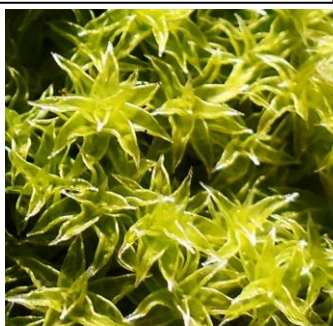
1/25(旧 11/15)太宰府市大佐野 エゾスナゴケによく似ている。地 面を覆う普通の蘇苔類だと思うが 自信がない。透明感が美しい。