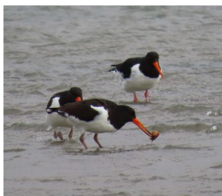
2枚貝を食べているようです。