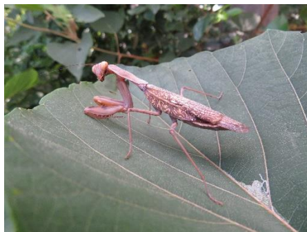
○こんなに美しいハラビロカマキリ