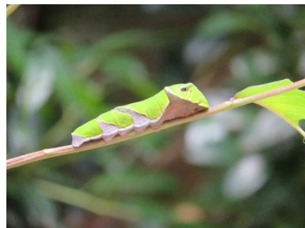
○モンキアゲハ(終齢幼虫)