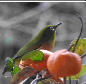
1/20(旧 12/10)筑紫野市天拝坂 庭に混群に混じて来て給餌のミ カンを食べて行く。常に上空を気 にするのは、身に付いた習性。