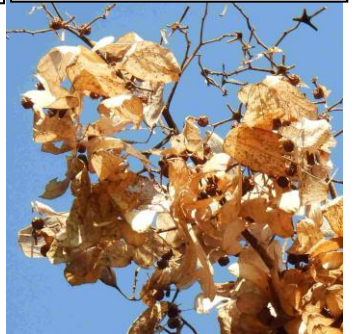
1/2(旧 11/21)筑紫野市武蔵 アオギリ 葉の様な心皮という種 の入物。舟形の縁に数個の種。 風で遠くに行くはずがまだ枝に・