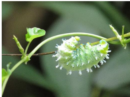
○シンジュサン(終齢幼虫)