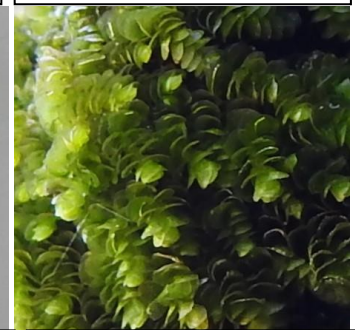
1/11(旧 12/1)筑紫野市天拝坂 ツタの枝に巻付くように生えてい る。蘇苔類だと思いが、丸葉の重 なりが、ヤスデゴケの仲間か？