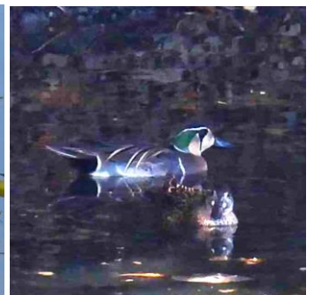
1/2(旧 11/21)筑紫野市搭原南 マガモ属のトモエガモ。この仲間 では一番旨いというのでアジガモ と呼ばれた。絶滅危惧Ⅱ類(VU)