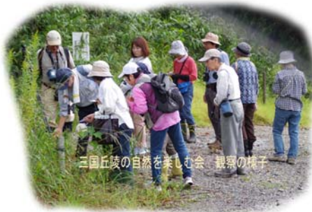
三国丘陵の自然を楽しむ会、観察の様子