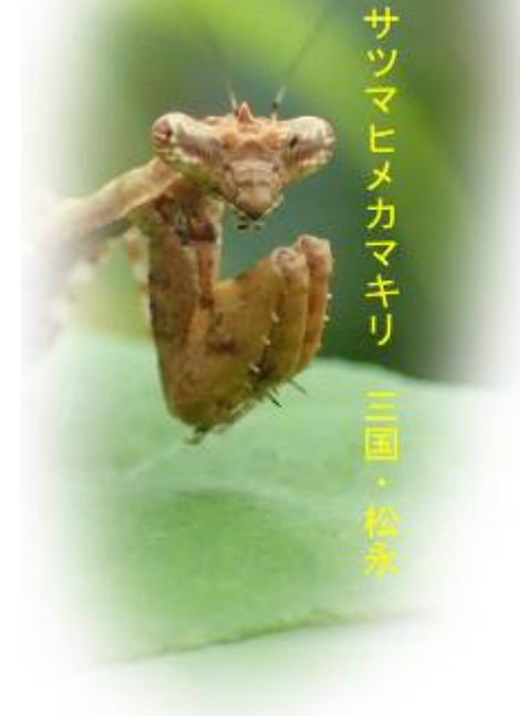
サツマヒメカマキリ 三国・松永