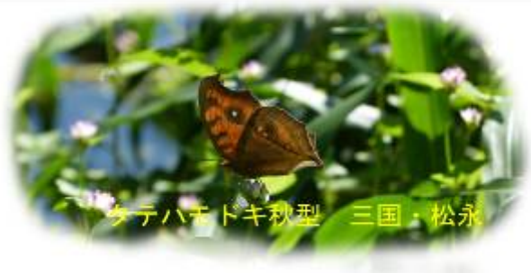
タテハホトキ秋型 三国・松永

10/23（日） 黒崎公園（みやま市） 時間：9:00～ 集合：黒崎公園第一公園グランド 090-7446-9047（野田）