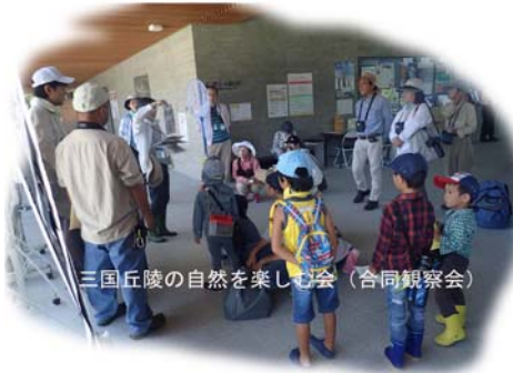
三国丘陵の自然を楽しむ会（合同観察会）