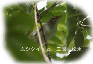
ムシクイ sp 三国・松永