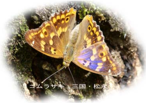
コムラサキ 三国・松永