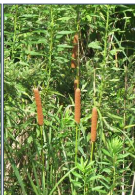
写真左から ガマの穂、コガマの穂、ヒメガマの穂