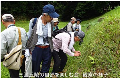
三国丘陵の自然を楽しむ会 観察の様子

10/4(第1土曜日) 自然観察会（植物・昆虫・野鳥など） 集合：九州歴史資料館駐車場 時間：9:30～12:30 問合せ：092-920-3072（松永）