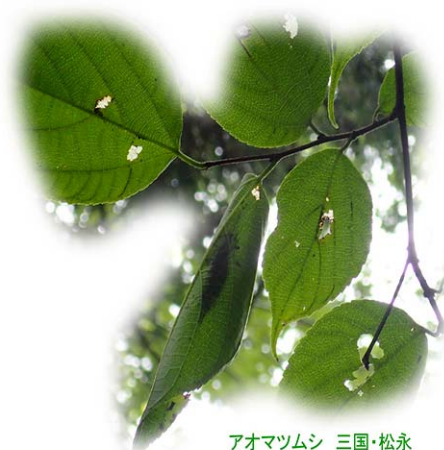
アオマツムシ 三国・松永

問合せ：0942-51-7064（古賀） hashida@kurumenoshizen.net（橋田） 共催：くるめネイチャーゲームの会