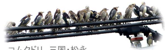
コムクドリ 三国・松永

9/28(日) 濃施山公園等（みやま市） 時間：9:00～12:00 集合：公園内すいせん橋 問合せ：090-7446-9047（野田）