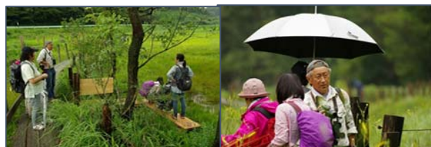
椋原湿原観察状況