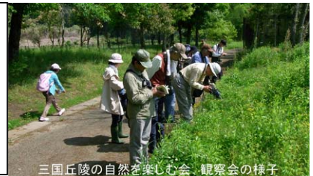
三国丘陵の自然を楽しむ会 観察会の様子

参加費：大人のみ200円（保険料込） ブログは 三国丘陵 で すぐにヒットします。