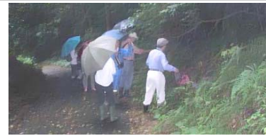
観察風景 三国・松永

要：保険料100円 8月の観察会はお休みです。 三国丘陵 ですぐにヒット します。