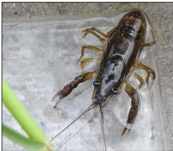
☆アメリカザリガニ☆