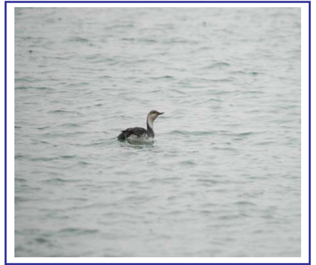
2005年3月2日 玄界灘のアビ