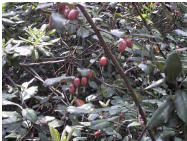
～ナワシログミの赤い実～