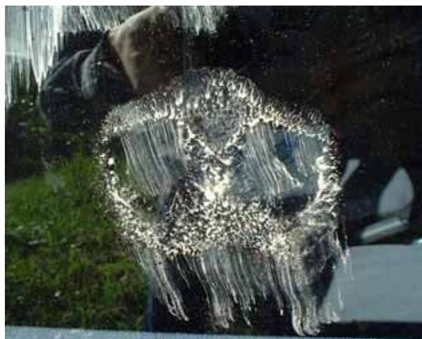
この写真は何でしょう？