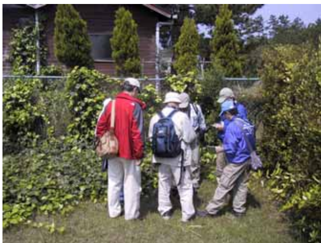
～イスノキの前にて～